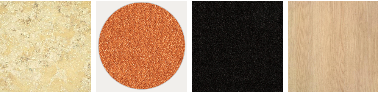
podlaha látko kovové prvky lamino - nábytek